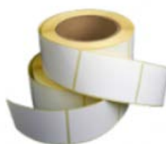
Support d'étiquettes en papier siliconé