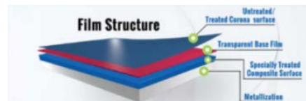
Film laminé multicouches